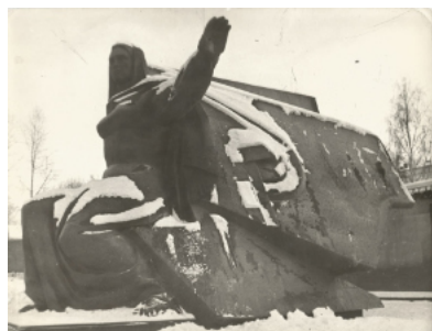
Советский тоталитаризм как социальная конструкция оказался более масштабным и глубоким, чем его модификации, обусловленные обстоятельствами места и времени.

Оставался шаг до создания политической партии. Но в монографии звучат пронизательные слова: «ирония истории за-