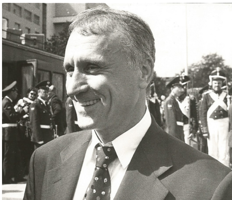
Автор монографии неоднократно отмечает интеллектуальное и политическое мужество героя книги – Геннадия Эдуардовича Бурбулиса.

оказался друг. «Он вчера не вернулся из боя...» Знаете, пожалуй, в этом и есть бесспорная заслуга книги: осталась память о курсе; о родном факультете; о государстве, основы которого были заложены с участием Г.Э. Бурбулиса. Остался вуз, филиал РАНХиГС в Екатеринбурге, ставший для автора книги второй альма-матер... Для вдумчивого читателя эта монография-воспоминание станет поводом для отказа от легковесных и тем самым вполне несправедливых оценок тех, кто несгибаемо верил в лучшее и добровольно попал в силки идеализма, кто стоически мыслил стратегиями гуманизма, но на жестоком суде истории оказался лишь на скамье свидетелей, успев – так вышло – пропустить вперед более расторопных акторов.