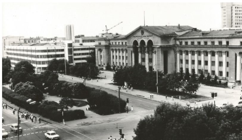
В этом здании УрГУ на философском факультете ГБ учили не сумме знаний, а пониманию ценности собственных исследований этого мира.

Мысли ГБ (на старших курсах) о новой модели комсомола, в основе которой должно было стать «пространство социального и профессионального самоо-